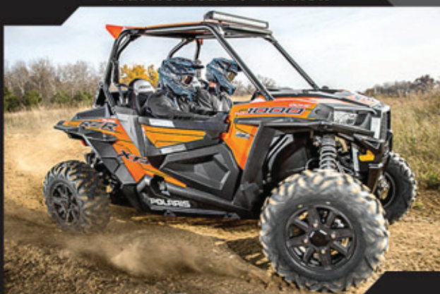
RZR XP 1000 Turbo