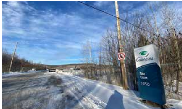
Cook site on January 10, 2025, work to update the former landfill's biogas and leachate collection system is underway.

The scheduled work includes the construction of a new biogas capture and destruction system, modernization of the current leachate collection system, the addition of a leachate collection network in the northern part of the site, along with landscaping and updating the sites sanitary sewer pumping system.