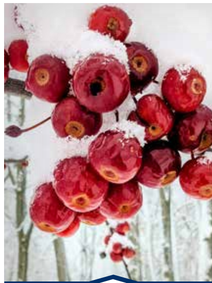
par Pam Taylor

In terms of cost, there's an obvious way to make the project more economically viable that hasn't been discussed much thus far - reallocating the $800 million currently earmarked for the demolition and reconstruction of the Alexandra Bridge, where the demolition is scheduled to take place in 2028. The justification for that project is that the condition of the bridge has deteriorated to the point where it can no longer support cars. Yet there are three other bridges within a two kilometre stretch that drivers can choose from. Leaving the Alexandra Bridge in its current form as a pedestrian and cycling bridge would help to promote the area as a tourist attraction, and the money reserved for that project could instead go towards the bridge in the east. The argument that the National Capital Region needs five bridges to handle cross-provincial traffic could instead justify the construction of this new bridge instead. Assuming, of course, that any of these projects survive the next federal election.