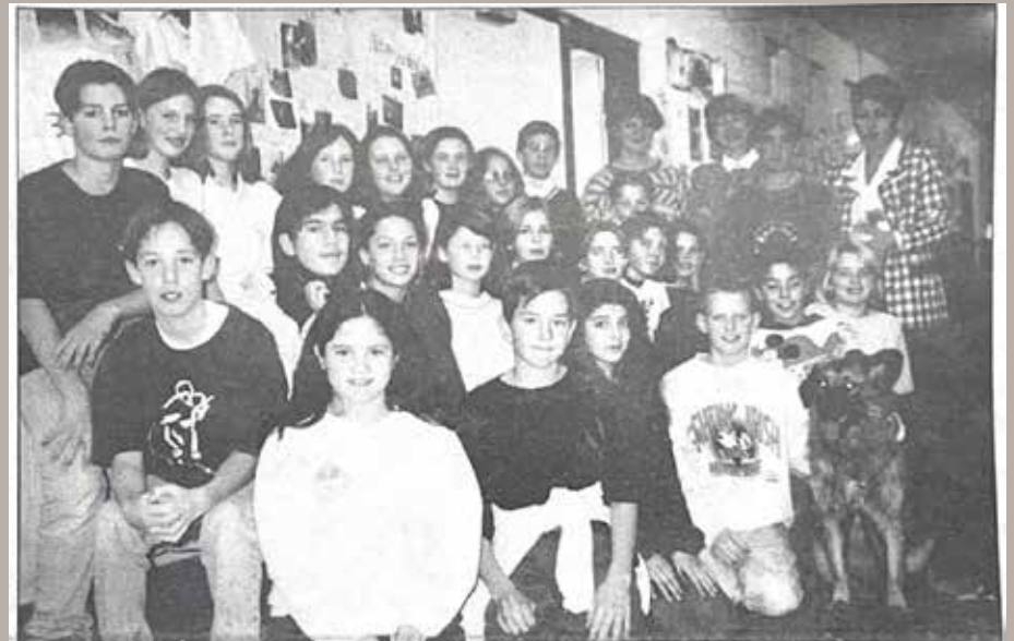
Une classe de l'école St-Mark a collecté plus de 400 $ pour la S.P.C.A. d'Aylmer; un don fortement apprécié en cette période de l'année. French immersion students at St. Mark's School raised more than $400 for the Aylmer SPCA; a much needed donation this time of year.

Regard vers le passé | Flashback—Le 11 décembre 1995