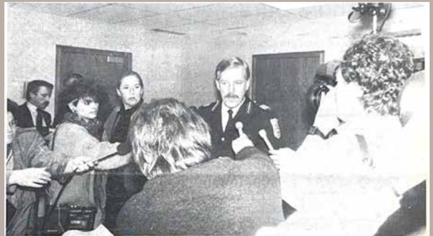
Aylmer Chief of Police André Langelier fields questions from a sea of reporters at city hall on Aylmer's new policy of public information on repeat criminals.

Aylmer Chief of Police André Langelier—Le 25 janvier 1990